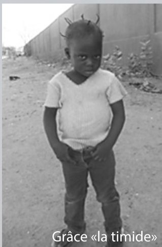
Grâce «la timide»