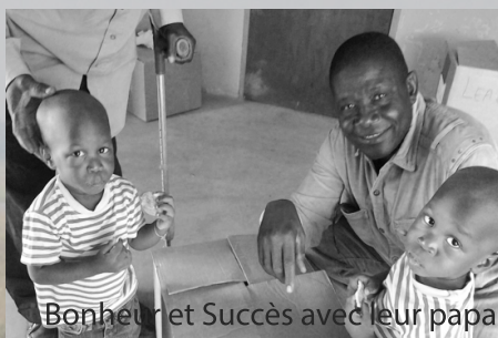
Bonheur et Succès avec leur papa

Le 28 mai, ce sont les 8 « canards » (âgés de 1 à 2 ans, dont 6 jumeaux) qui ont rejoint définitivement le nid familial.